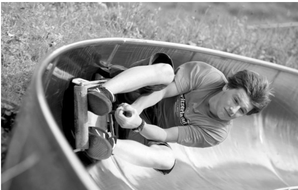
Spass in der Lenzerheide