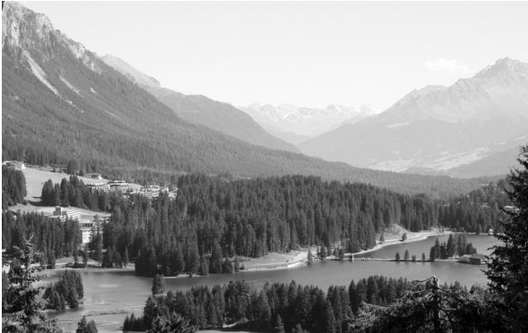
Heidsee in der Lenzerheide