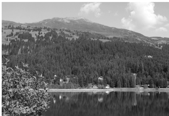
Heidsee und Parpaner Rothorn