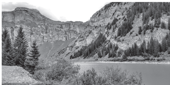
Lag da Pigniu

Die 765 erstmals als Andeste erwähnte Gemeinde änderte im Jahre 1943 offiziell ihren Namen von Andest Andiast, was der heutigen romanischen Aussprache am Ort entspricht. Die Herkunft des Namens ist unklar. Das in Graubünden verbreitete Suffix *-este gehört unbestrittenermassen zu einer vorrömischen oder vorkeltischen Sprachschicht, die aber nicht näher bestimmt werden kann.